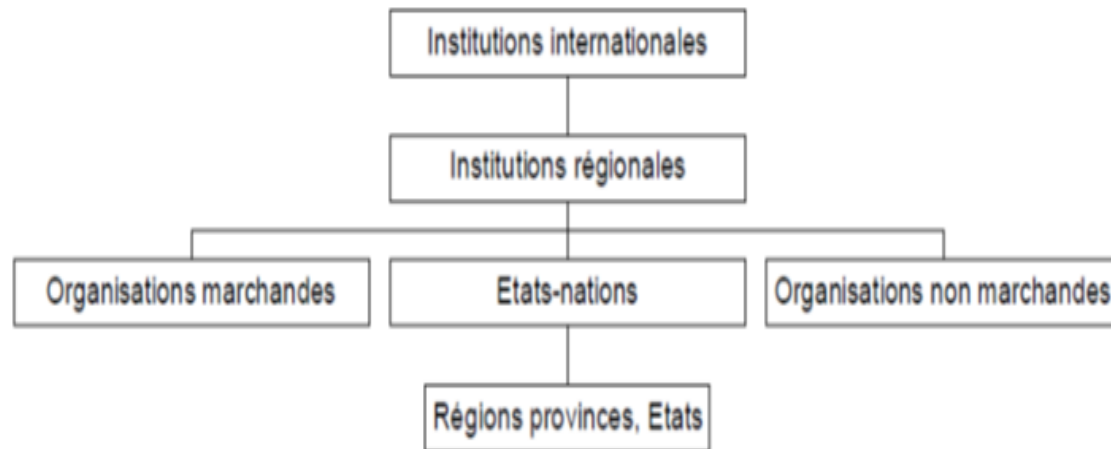
FIGURE 1 – La mise en concurrence des États-nations dans la fourniture de biens publics

Article de JM.Siroën : « globalisation et gouvernance : une approche par les biens publics »